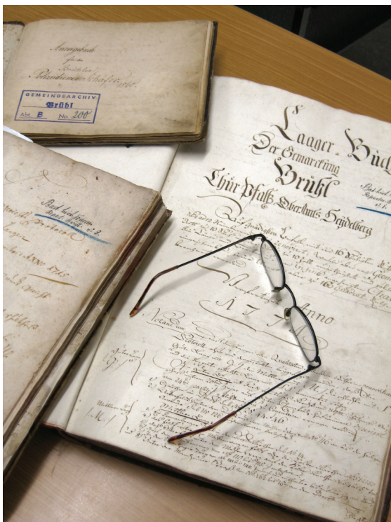
Weitere Schätze des Gemeindefacharchivs in der „Ortsschell“ Nr. 12

Die Gemeinde Brühl kann stolz und glücklich sein, mit diesem Protokollbuch einen direkten Schlüssel zu einem wichtigen Abschnitt ihrer Geschichte zu besitzen. Kein Sachbuch oder Aufsatz kann mit dieser Direktheit und Vielschichtigkeit so lebendig Zeugnis von der örtlichen Historie ablegen wie ein solches Originaldokument. Mit diesem Artikel sollte ein Überblick gegeben werden, um auch späteren Generationen die Lust daran zu vermitteln, die es mit sich bringt, wenn man in dieser sich rasend schnell weiter entwickelnden Gegenwart mit elektronischer Kommunikation, Wissensverwaltung und Wissensvermittlung, mit Globalisierung und Uniformisierung der Wirtschaft und Gesellschaft und mit unabsehbaren Veränderungen der Umwelt und des Klimas seinen Erlebnishorizont verbreitert und in die Spuren vergangener Zeiten eintaucht, wenn man lernt sie zu lesen, zu begreifen und in die Neuzeit zu übertragen, sodass alle Interessierten dankbar davon profitieren können. Mögen in Zukunft noch viele Brühler „Hobby-Historiker“ das Buch und seine Nachfolger im Gemeindearchiv (oder irgendwann vielleicht elektronische Abbilder davon) studieren, sich in die uns mehr und mehr fremd werdende Vergangenheit versetzen und begreifen, wie ihre jeweilige Gegenwart zu dem wurde, was sie dann sein wird! Denn nach wie vor wird der Grundsatz gelten: Wer nicht weiß, woher er kommt, kann nicht erkennen, wohin er geht!